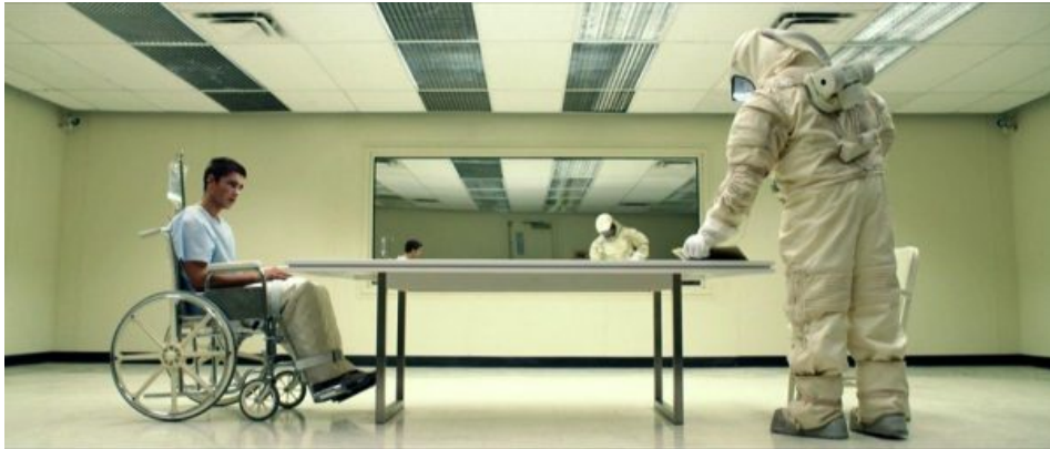
Primera trobada entre el Dr. Nomad i en Nic.

veritat es tornarà més i més frenètica ( presteu atenció a les paraules del camioner ).