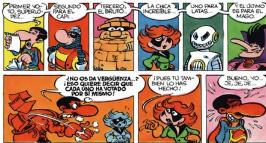
Els membres del Supergrup intenten votar qui serà el líder del grup...

- La ciutat de Barcelona és un altre dels protagonistes de Superlópez. Això li dona un aire molt especial a la historieta, l'equivalent a allò que senten els lectors nord-americans quan veuen reflectida la ciutat de Nova York als còmics de superherois. Fins i tot. Com et documentes a l'hora de reflectir els paisatges urbans? És el la similitud amb la Ciutat Condal deliberada o simplement va sorgir així?