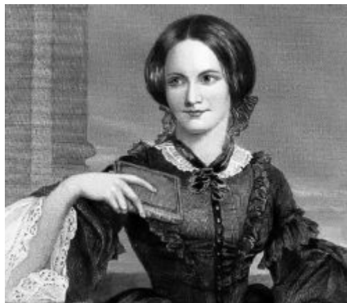
Charlotte Brontë va ser una autora famosa a la seva època, com les seves germanes, Emily i Anne.

Amb totes aquestes peripècies i desgràcies sembla que Charlotte Brontë es negui que la Jane trobi la felicitat on ho fan habitualment les heroïnes de les novel·les romàntiques, és a dir, a les institucions tradicionals com la família, la religió o el matrimoni. De fet, al llarg de l'obra totes elles es revelen com a paradisos artificials, mers miratges que busquen comprometre la integritat de la protagonista. El seu camí cap a la realització personal consistirà, doncs, a tenir la fortalesa de caràcter necessària per rebutjar les trampes del patriarcat i a seguir endavant passi el que passi.