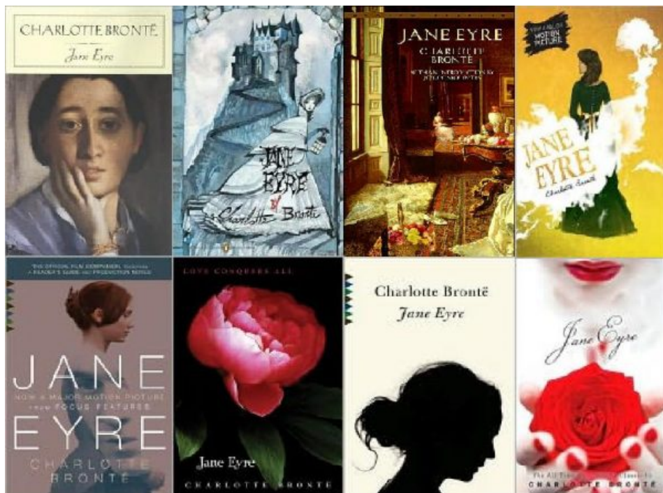
Algunes de les portades de les (moltes) edicions de Jane Eyre.

Aquest crit de la Jane Eyre ha donat veu a les aspiracions silenciades de milions de lectors des de fa dos segles. No és gens estrany que el personatge s'hagi convertit en una icona del feminisme i la novel·la que porta el seu nom, en un clàssic de la literatura victoriana.